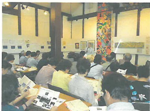
NPO法人泉州佐野にぎわい本舗の説明