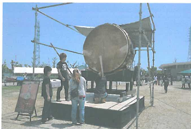
6尺5寸一打募金大太鼓