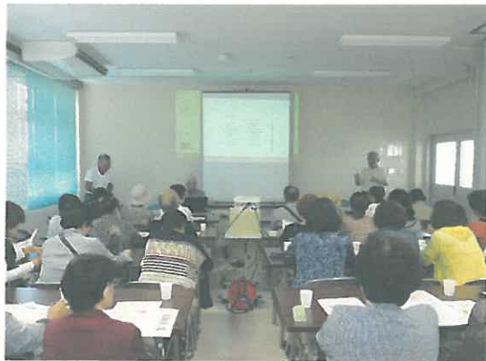
箱の浦まちづくり協議会の説明