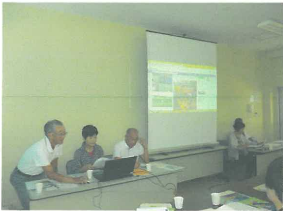
阪南市市民活動センターの説明