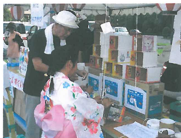
子どもあそび広場