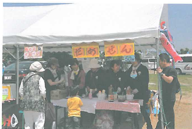
いずみ太鼓模擬店