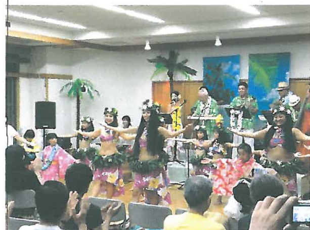
緑ヶ丘ハワイアンのタベ