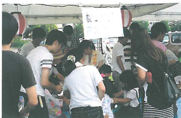
子どもあそび広場