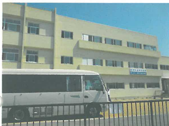
阪南市市民活動センター夢プラザ（旧尾崎小学校跡）