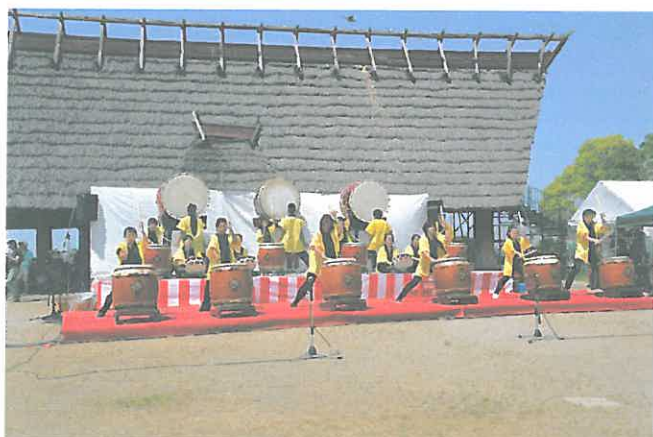
太鼓教室生「繫 kei」の演奏