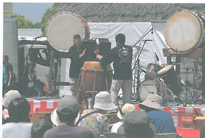
太鼓正職人太鼓の張り替え実演