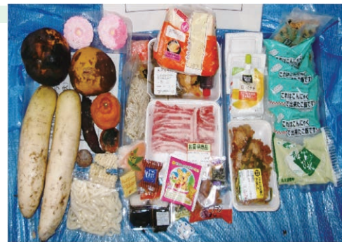
捨てられた手付かずの食品例