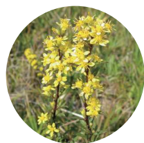
アキノキリンソウ

穂状の花が、酒が発酵する時の泡に見えることから、別名をアワダチソウ（泡立ち草）とも呼ばれるそうです。