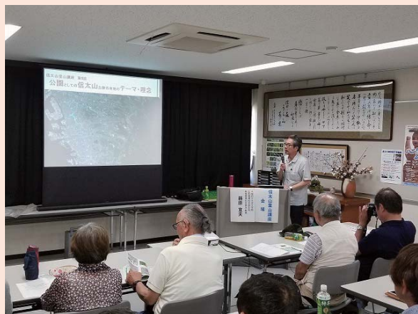
藤原氏による講義

公園として、保全・活用する信太山丘陵市有地の経緯や公園の理念・方針、また信太山の里山環境の紹介や保全上の問題等について講義がありました。