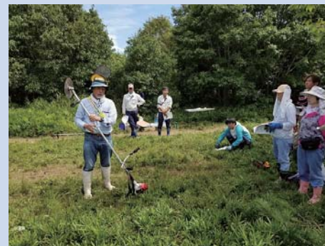
三輪氏による道具の使い方の説明