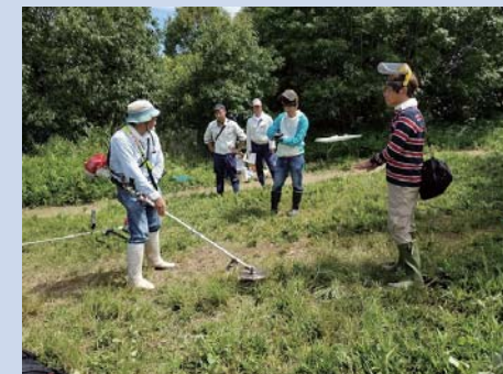
説明を聞く受講生