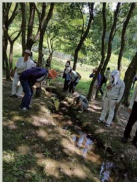
ホタルが出現するせせらぎ

当初の計画から段階を踏んで進められてきた活動の変遷について説明して頂きました。また、参加者からの質問により、管理運営の体制についても紹介頂きました。これから公園づくりを進めていく信太山丘陵市有地にとって、今後の活動の参考になりました。