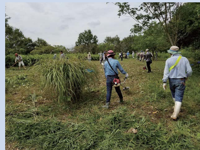
実践参加：定例の環境保全活動と合流