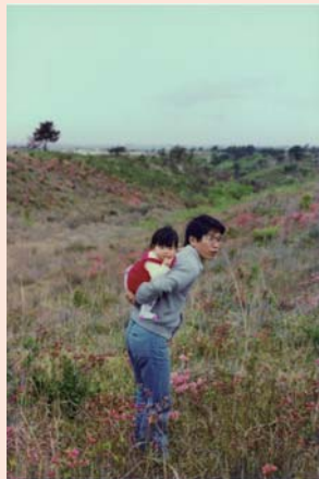
諸和 50 年代の信太山丘陵市有地