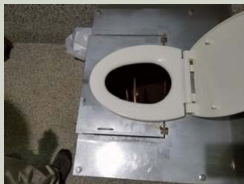
バイオマストイレの説明