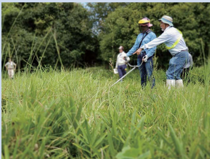
刈払機を体験する受講生