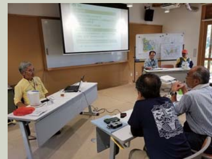
那須氏による講義