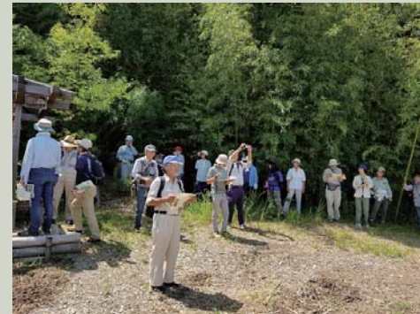
眺望を活かした自然環境の管理について説明を受ける