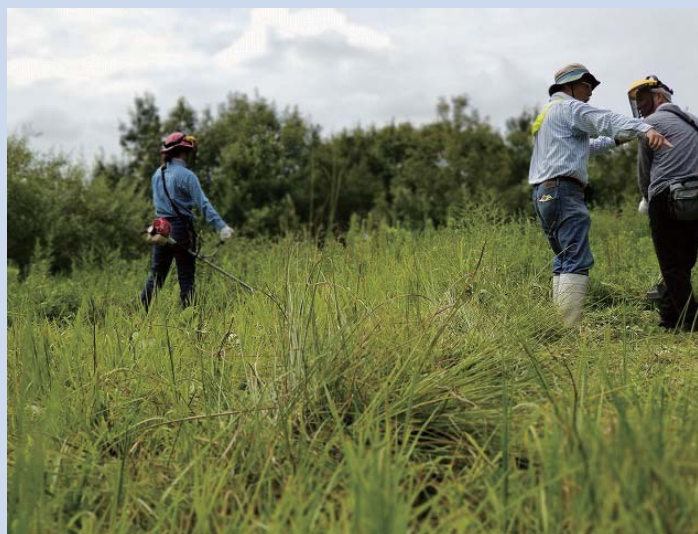
丁寧な指導により技術が向上