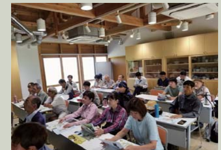
森の館で行われた講義の様子