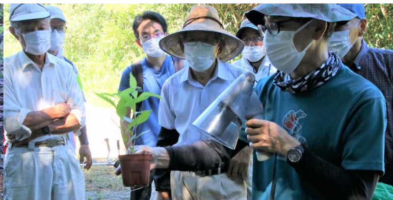
藤原先生から野草の解説