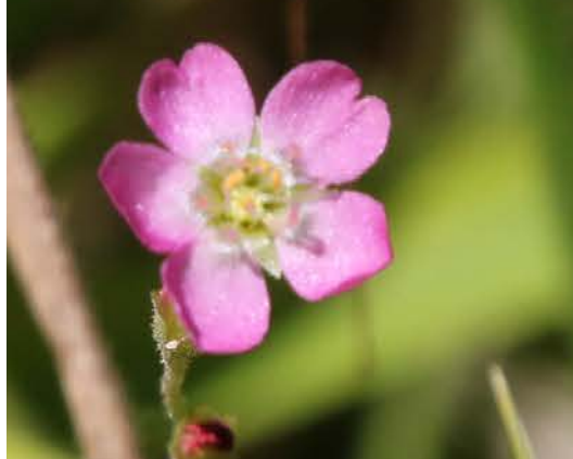
コモウセンゴケの花