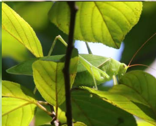
サトクダマキモドキ