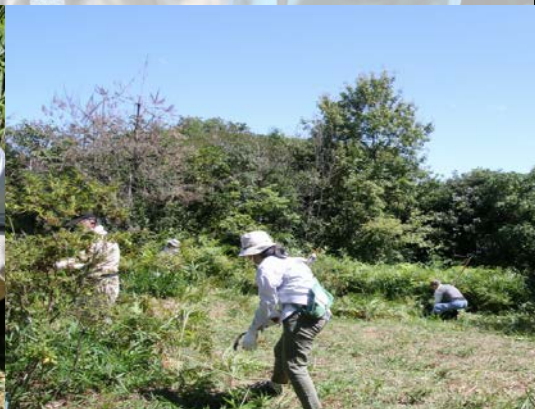
東側草原の草刈り