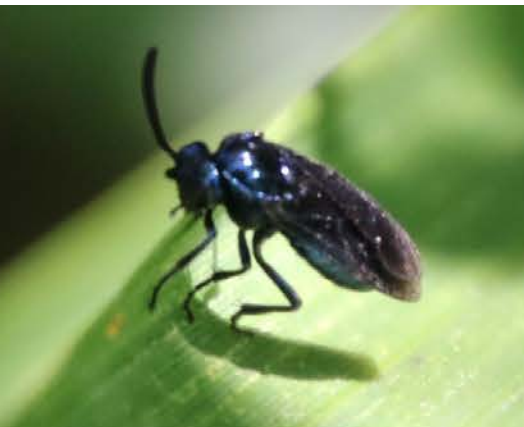
ルリチュウレンジバチ