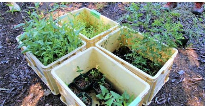
ヒヨドリバナやスミレなどの野草