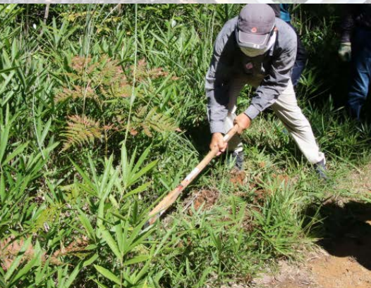
植え付け場所づくり