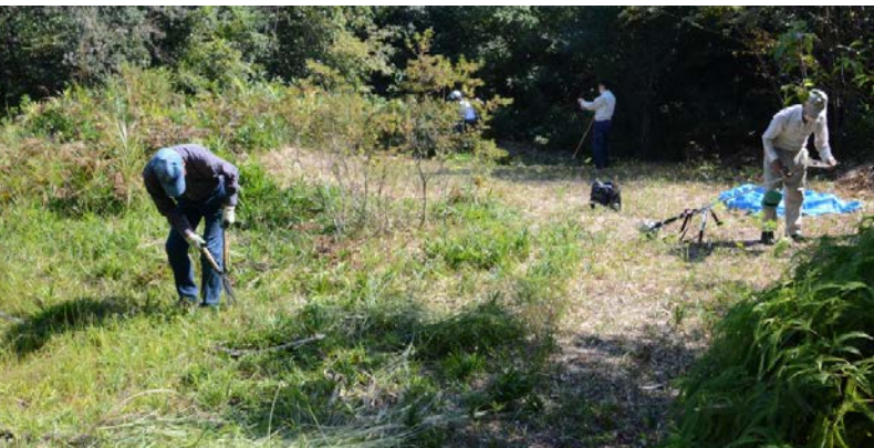
先月に続いて草原の草刈り