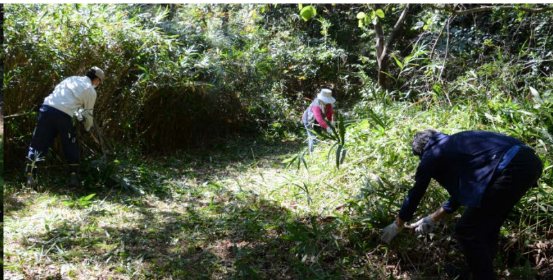
大野池沿いの道の草刈