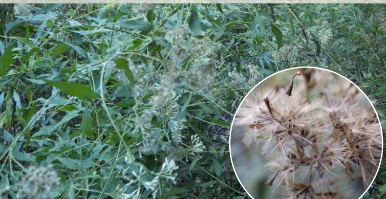
道沿いのヒヨドリバナにはタネが