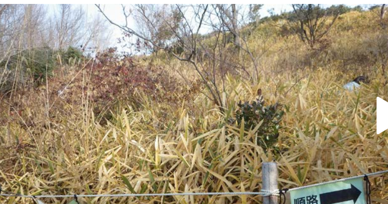
西側ツツジ低木林 草刈前