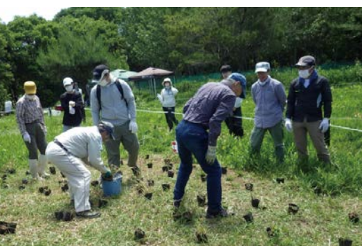
チガヤ苗を植付け場所に配置