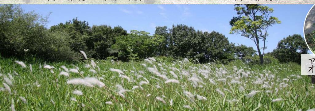
西側草原に自生しているチガヤ