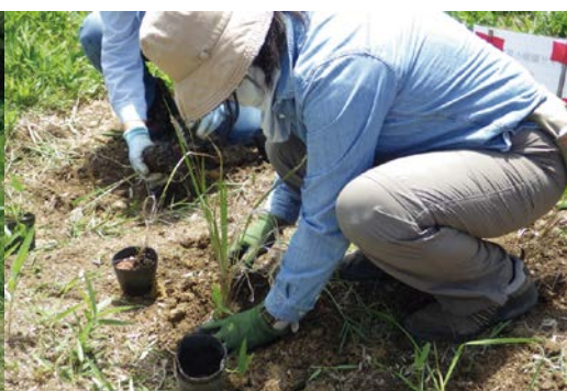
チガヤ苗の植付け