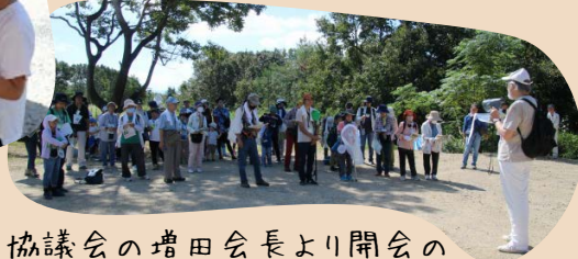
協議会の増田会長より開会の挨拶をしていただきました。