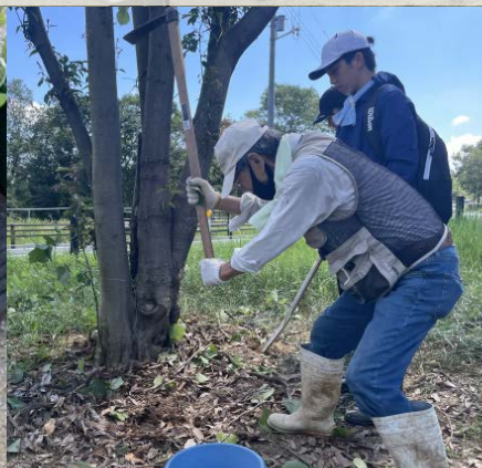
野草植付けの様子