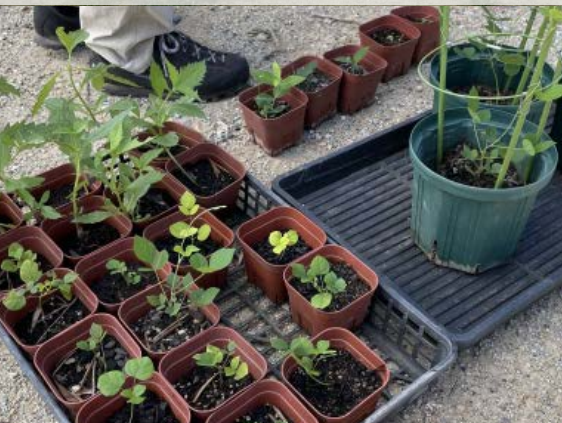
野草 (キキョウ、タンキリマメ、ヒヨドリバナ、ホソバリンドウ)