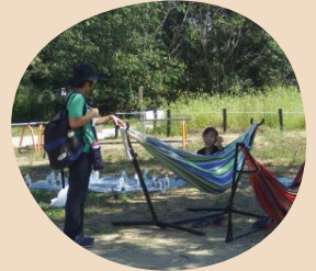
ハンモックに乗って木陰で涼めます〜