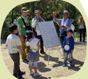
沢山生きものを捕まえた子どもにメダル授与

信太山丘陵里山自然公園では、生物多様性の豊かな里山的二次自然の復元と保全をめざして、環境保全活動に取り組んでいます。