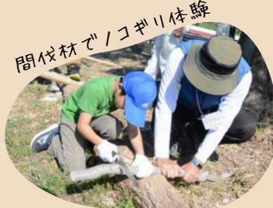
間伐材でコギリ体験

9月16日(土)、2024年夏に信太山丘陵里山自然公園第1期開園区域が開園する事の市民への周知、管理棟の内覧会、利用プログラムの実践を目的としたイベントを協議会メンバーの皆さんと開催しました。