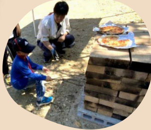
間伐材でピザ焼き体験