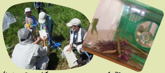
参加者の皆さんと、35種類の生きものを捕まえることができました！