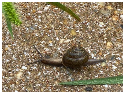
カタツムリ的一种