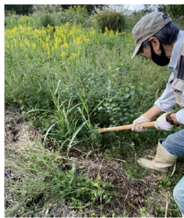
外来種駆除の様子