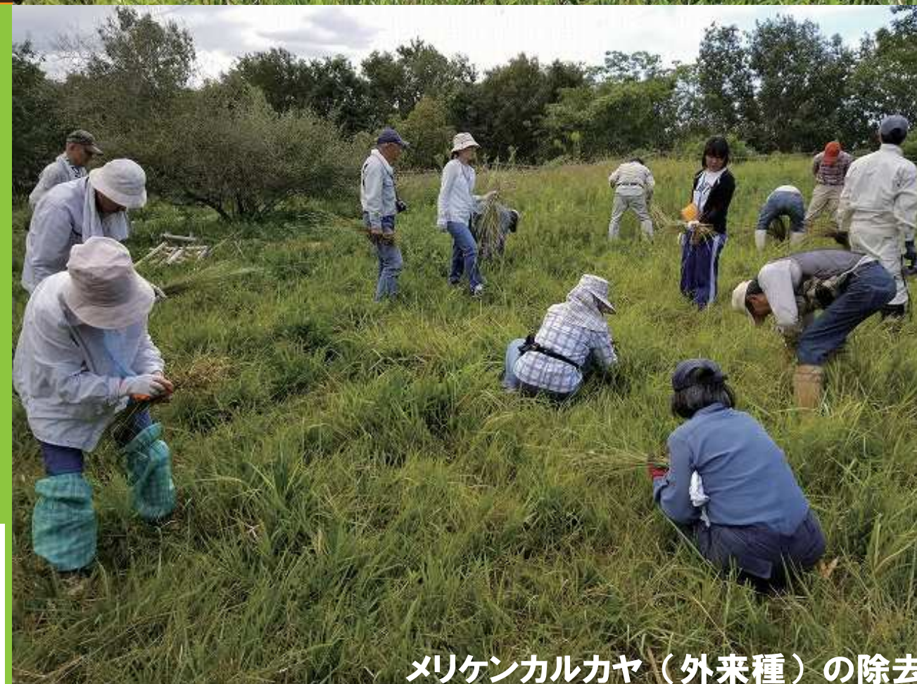
メリケンカルカヤ（外来種）の除去