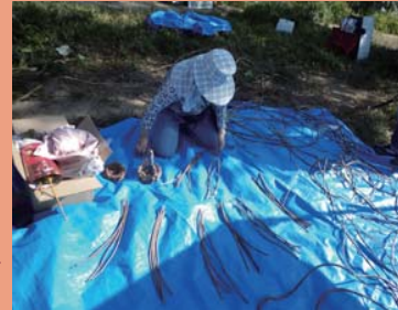
かごの中心の部分。ツルを等分に人数分切っていきます。