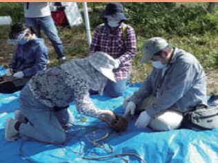
一人ひとり丁寧に教えて頂きます。