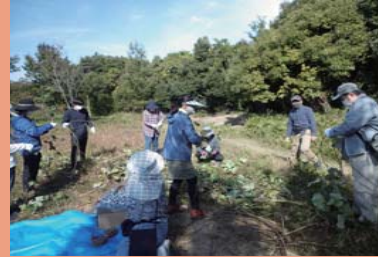
ツルの葉っぱをもぎ取ります。