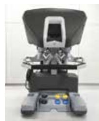
手術操作コンソール