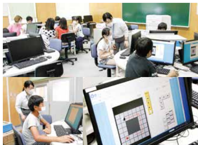
小学5年生「プログラミング教育」ICT支援員の授業

「コンピュータの授業？」「全員がIT企業をめざす？」そんな風に思うかも知れません。