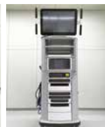
ビジョンシステム