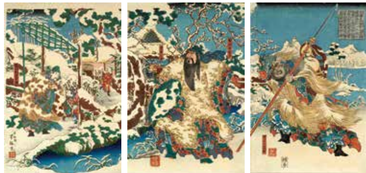
「三顧茅廬図」歌川芳梅筆