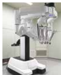
手術ロボットアーム