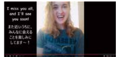
ALT（外国語指導助手）からの動画配信