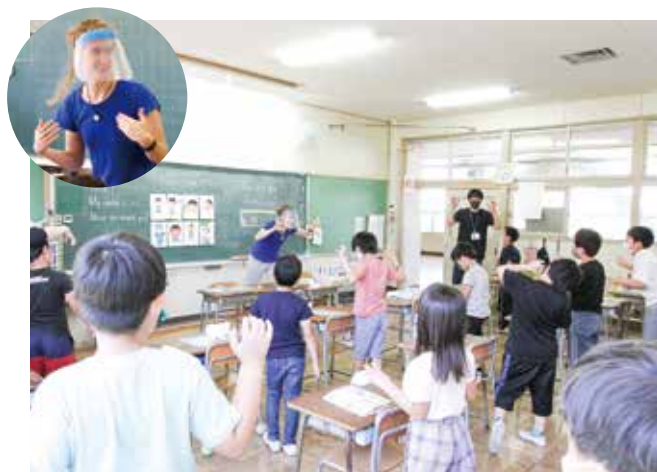
小学3年生「外国語（英語）活動」ALTの授業

「聞くこと」「読むこと」「話すこと」「書くこと」の力を総合的に育むことをめざして、小学3・4年生は年35時間「外国語活動」の授業、小学5・6年生には年70時間「外国語」の授業が始まっています。