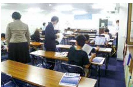
4～6人に講師1人がつく個別指導

今年度から小学4年生の参加が可能になり、小学5・6年生には英語の授業も開始しています。