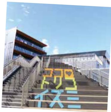
令和 4 年度 市役所新庁舎が令和 5 年 1 月にグランドオープン