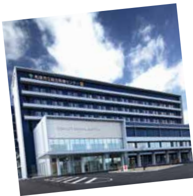
平成 30 年度 総合医療センターが開院