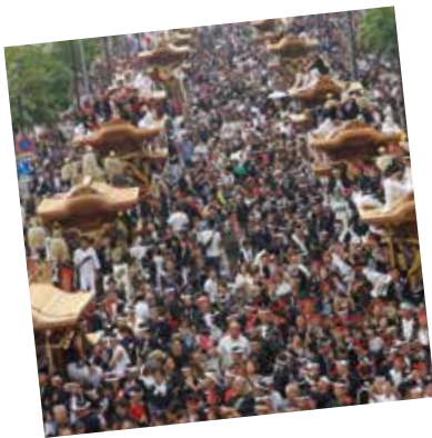
平成 28 年度 和泉府中駅前でだんじり大集合