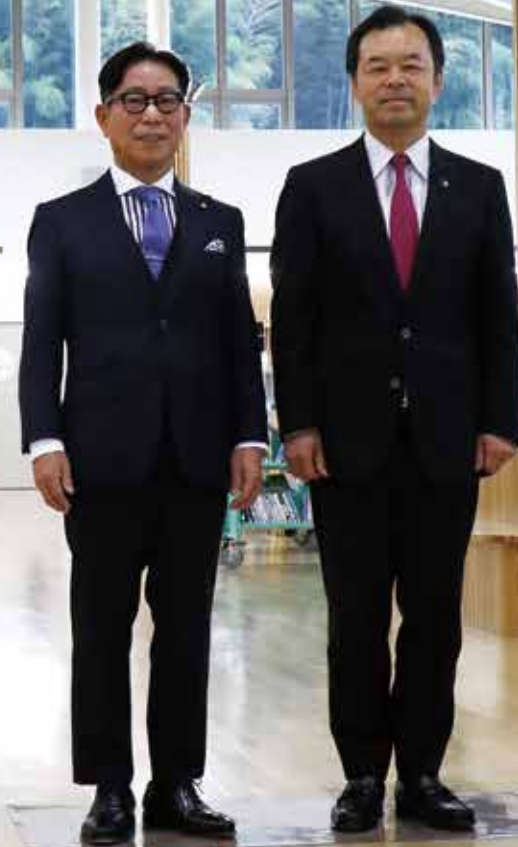
令和 7 年 4 月に開校した槇尾学園のメディアセンターで撮影