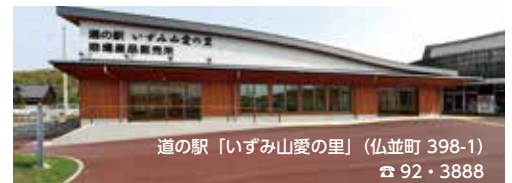
道の駅「いづみ山愛の里」(仏並町 398-1) ☎ 92・3888

道の駅では、旬を迎えた地元産のいちごやみかんを使った商品が登場。さらに「旬菜レストランつむぎ」では、大阪・関西万博で話題を呼んだ人気メニューや、ボリューム満点の定食が楽しめます。和泉の冬の味覚を、ご堪能ください