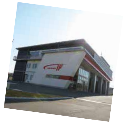
令和 2 年度 中央消防署が開署