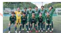
和泉テクノ FC さん (女子サッカーチーム)

PR 大使の皆さんからの メッセージや動画は、随時、 市ホームページに掲載します。