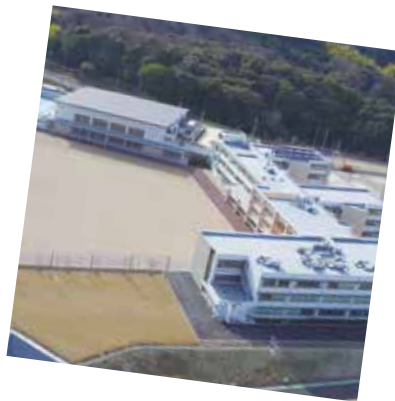
平成 29 年度 南松尾はつが野学園が開校