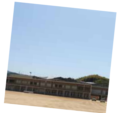
令和 7 年度 横尾学園が開校