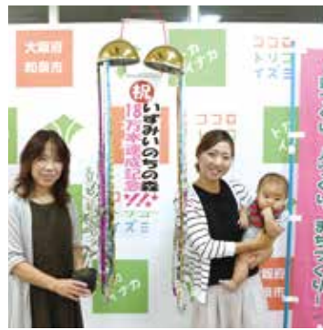
平成 31 年（令和元年）度 いずみいのちの森プロジェクト 18 万本の植樹達成