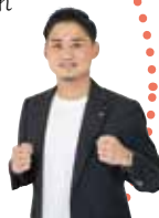
京口絃人さん (元 IBF 世界ミニマム級王者・元 WBA 世界ライトフライ級スーパー王者)

この度は和泉市の市制施行 70 周年、心よりお祝い申し上げます。 「いずみ」を数字で表すと「1.2.3」、「いずみ」 を口に出して言うときスマイルに^^。「和泉」の漢 字も清らかで美しく大好きです。私自身、和泉市 出身として和泉伝説の葛の葉物語を題材とした「葛の 葉異聞」と「葛の葉外伝」を歌わせていただく中で、 故郷の魅力をお伝えできることに誇りを感じていま す。これからも、地域の発展と更なる輝きを願い、 70 周年を迎える和泉市の未来が、夢や希望に 満ち溢れて、より素晴らしいものにな りますように祈念いたします。