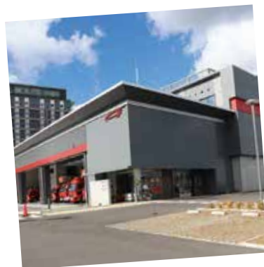
令和 6 年度 消防本部が移転