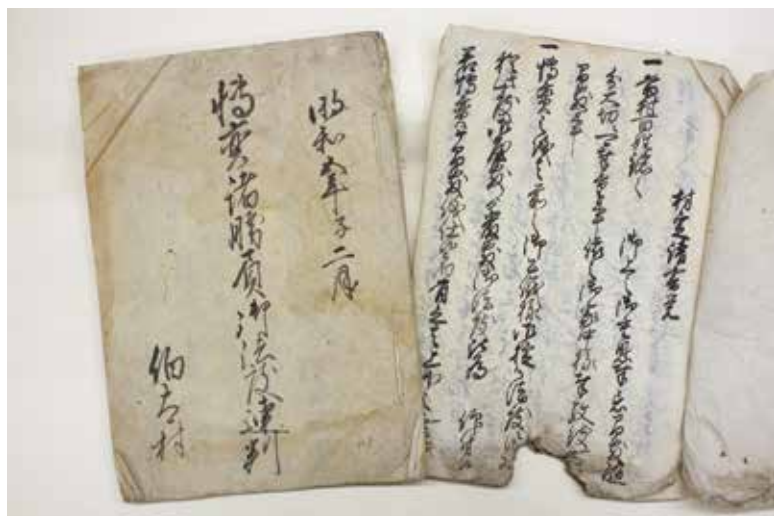
18世紀中頃の伯太村の村掟

『和泉市の歴史』も残すところあと一冊。しかし、すでに刊行を終えた地域でも、未調査の史料が発見・提供され、これまで知られていなかった歴史が明らかになっています。その一端を紹介しましょう。