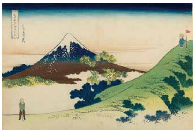
「ちょっと可笑しなほぼ三十六景 むずかしいグリーン」 しりあがり寿筆