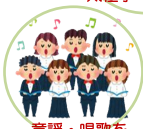
童謡・唱歌を 歌おう