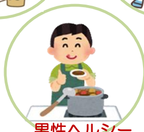
男性ヘルシー クッキング