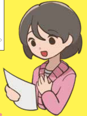
イラスト:小澤 遥(駒込高校・美術部)

早期発見のカギは、定期的ながん検診を受けること。貴重な機会を、どうか逃さないください。