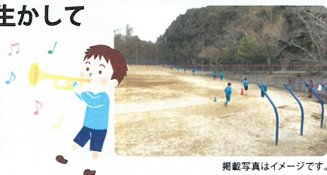
掲載写真はイメージです。

5年生から、学級・学年の枠を超えてスポーツや芸術文化に親しむ部活動に参加可能とし、児童生徒に生きる力をはぐくむことをめざします。(実施部活動、詳細については検討中です。)