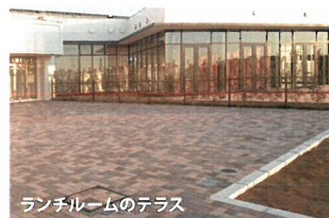
ランチルームのテラス