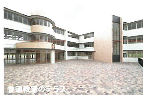
普通教室のテラス