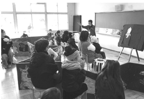
読み聞かせ講座(大人向け)