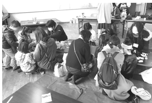
鬼の仮装工作づくり

今後、子育て・教育部会で振り返りなどを行い、第2弾企画についても考えていく予定です！