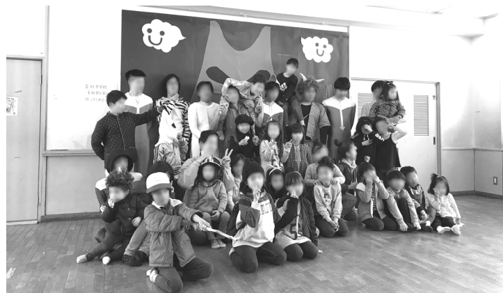
鬼ごっこの後はみんなで記念撮影！