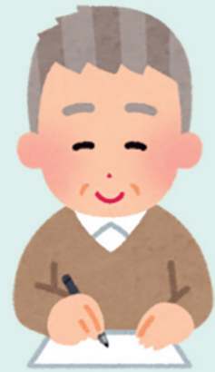
避難行動要支援者 〇〇 〇〇さん

個別計画の作成は任意ですが、意向確認が必要です。 作成しない場合でも「個別支援計画作成意向確認書」(黄)を必ずご提出ください。