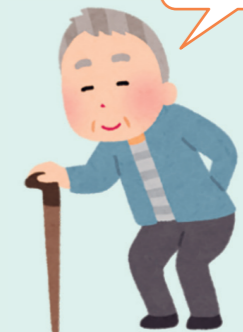
ご近所の 〇〇 〇〇さん