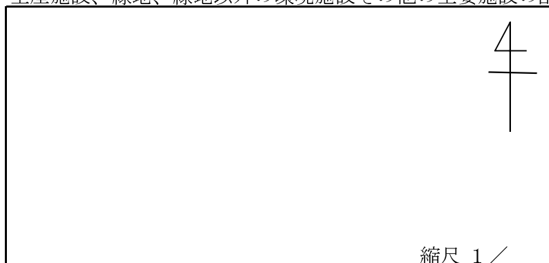
生産施設、緑地、緑地以外の環境施設その他の主要施設の配置図