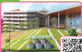
ららぽーと和泉・コストコ