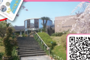
和泉市いずみの国歴史館