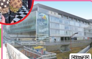
和泉シティプラザ