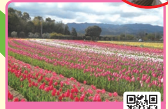
和泉リサイクル環境公園