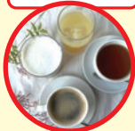
Halegina cafe (河野邸内)