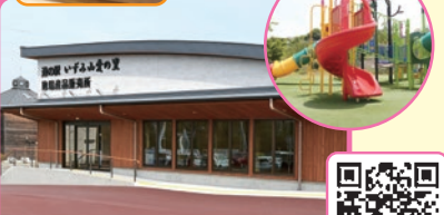
道の駅いずみ山愛の里