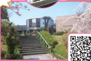
いずみの国歴史館