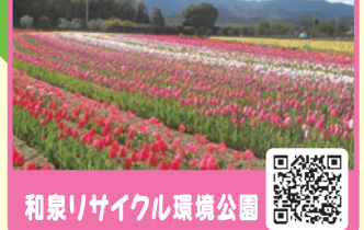
和泉リサイクル環境公園