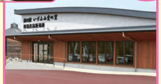
道の駅いずみ山愛の里