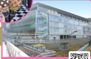
和泉シティプラザ