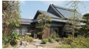
河野邸 Art Gallery & Laboratoire

「美術館のあるアートにあふれたまち」として、たくさんの人に街中にあるアートを感じながら楽しんでもらえるような色々な取り組みをしている地域のこです。