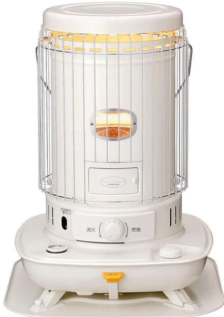
画像にマウスを合わせると拡大されます

ホーム&キッチン > 家電 > 空調・季節家電 > ヒーター・ストーブ暖房 > 石油暖房 > 石油ストーブ