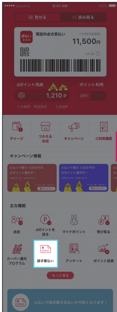
①ホーム画面から「請求書払い」をタップ