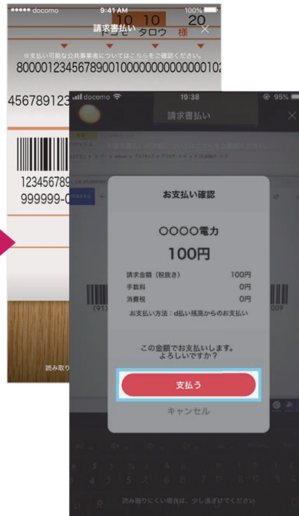
③支払う請求書のバーコードを読み取り、支払い内容に問題が無ければ「支払う」をタップする