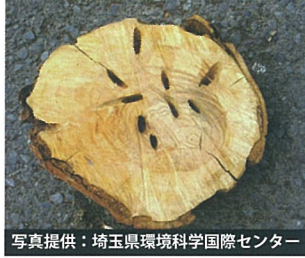
幼虫に食害された樹木の内部

公園や街路樹などのサクラが加害されると 景観が悪化 したり、 お花見を楽しむことができなくな ってしまいます。