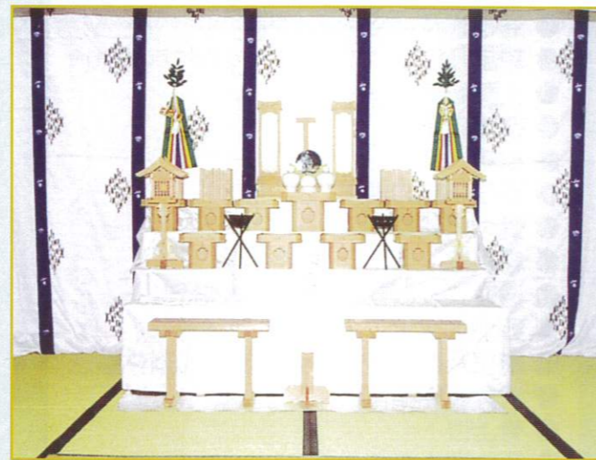
神式飾 72,000円 幅・185cm 奥行・158cm