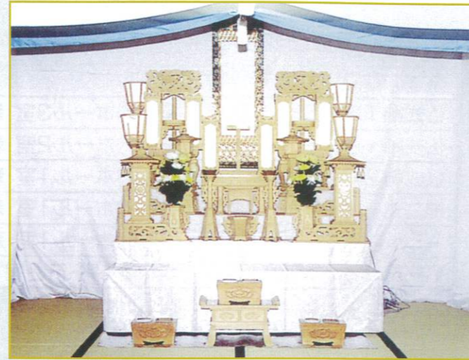
4 段飾 126,000円 幅・185cm 奥行・160cm