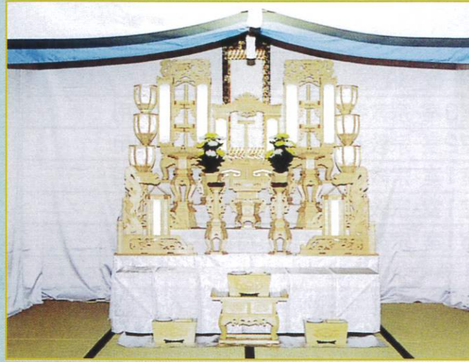
5 段飾 192,000円 幅・200cm 奥行・200cm