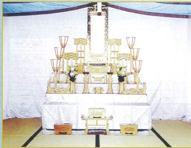
3 段飾 72,000円 幅・185cm 奥行・158cm