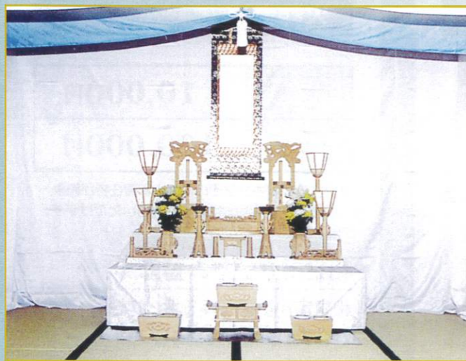
2 段飾 38,000円 幅・167cm 奥行・150cm