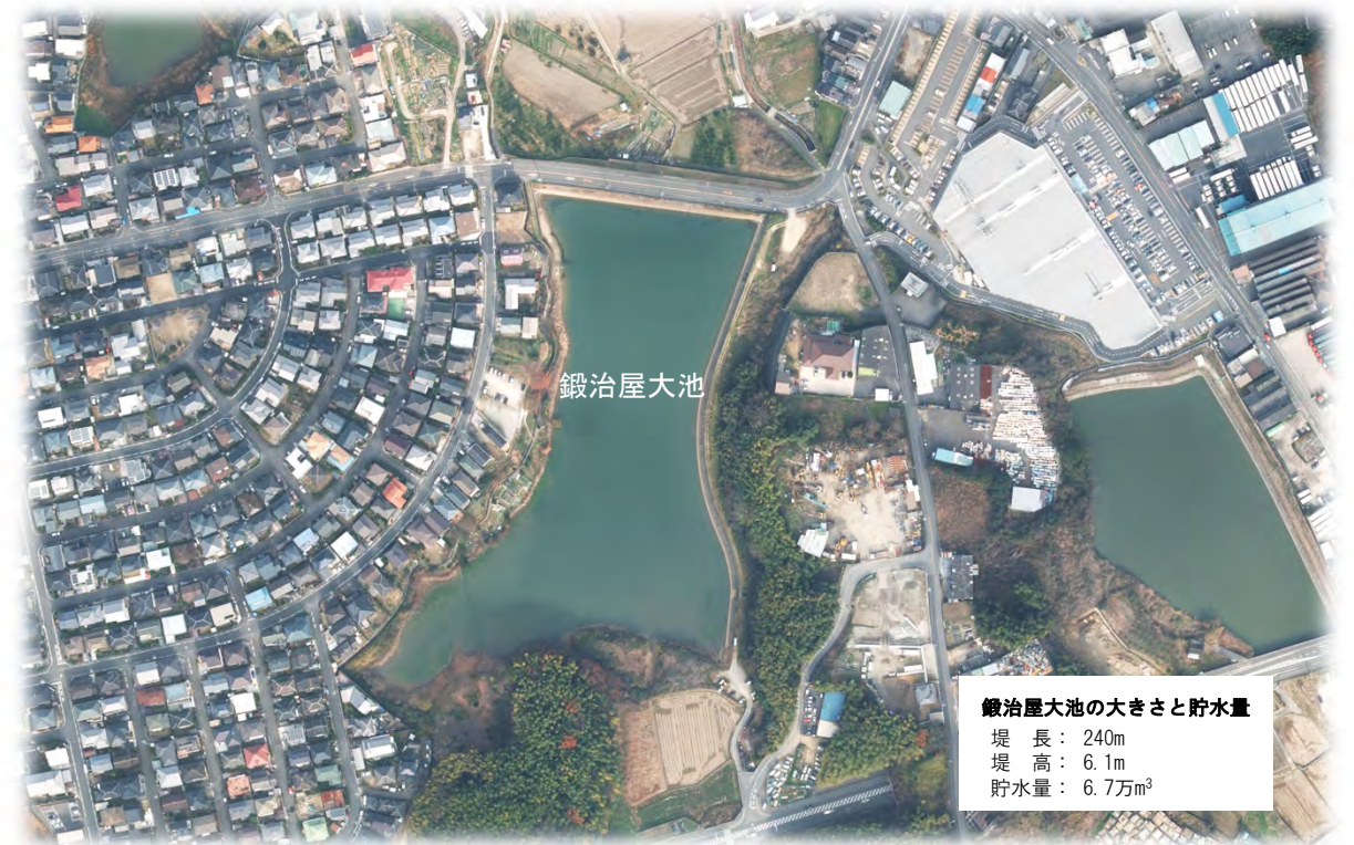
鍛冶屋大池の大きさと貯水量 堤長：240m 堤高：6.1m 貯水量：6.7万m 3