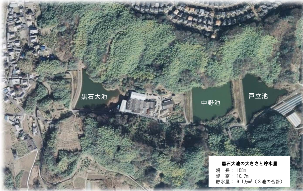
黒石大池の大きさや貯水量 堤 長: 158m 堤 高: 10.7m 貯水量: 9.1万m 3 (3池の合計)