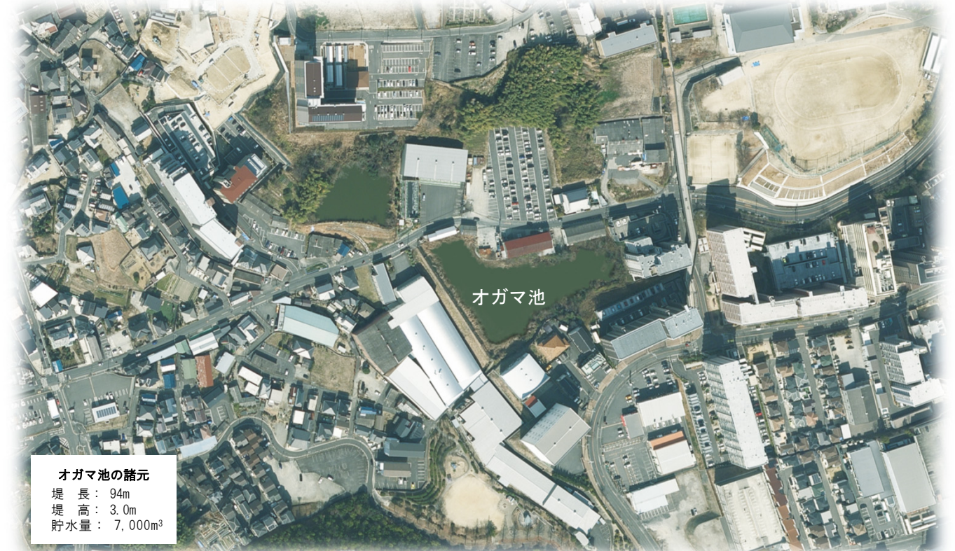
オガマ池の諸元 堤長：94m 堤高：3.0m 貯水量：7,000m 3