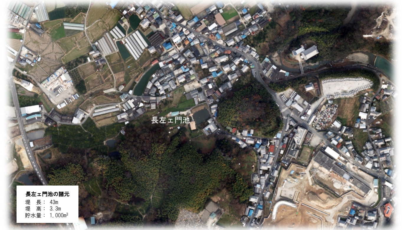
長左エ門池の諸元 堤長：43m 堤高：3.3m 貯水量：1,000m³