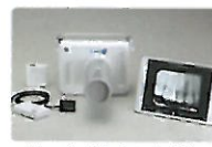
ポータブルレントゲン