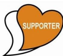
あいサポート シンボルマーク

このバッジをつけている人は、「あいサポーター研修」という研修を受けている人です。障がいのある人が困っている時に手助けをします。