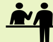
かんこうあんないじよ 観光案内所