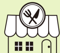
いんしょくてん 飲食店