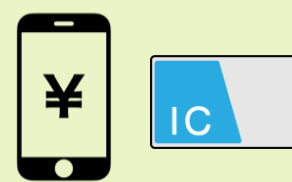
ていき スマホ・定期