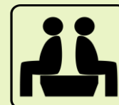
まちあいしつ 待合室