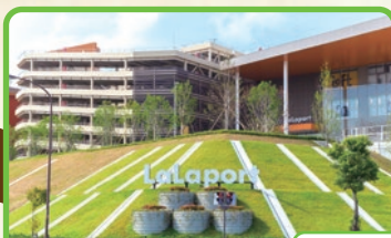
ららぽーと和泉・コストコ