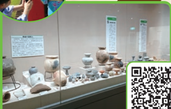
いずみの国歴史館