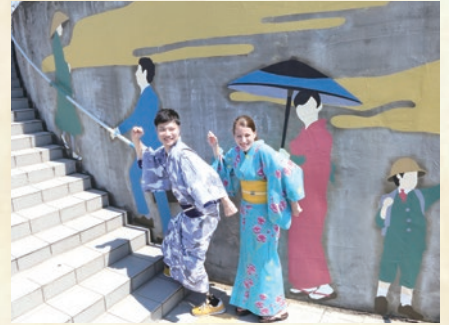
和泉シティプラザ