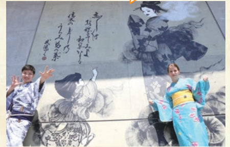
和泉シティプラザ