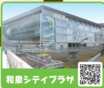
和泉シティプラザ