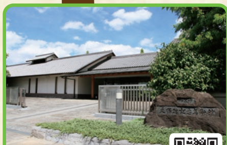
和泉市久保惣記念美術館