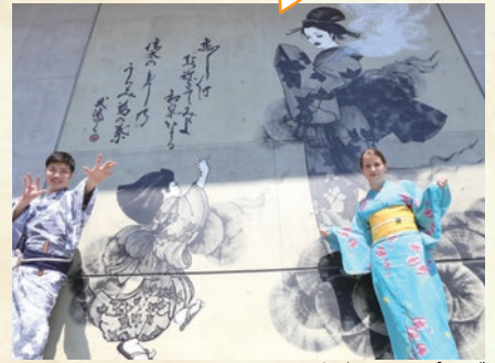
和泉シティプラザ