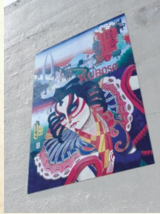
エコール・いずみ