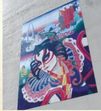
エコール・いずみ