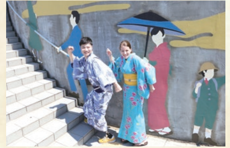
和泉シティプラザ