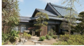
河野邸 Art Gallery & Laboratoire

「美術館のあるアートにあふれたまち」として、たくさんの人に街中にあるアートを感じながら楽しんでもらえるような取り組みをしている地域のこです。