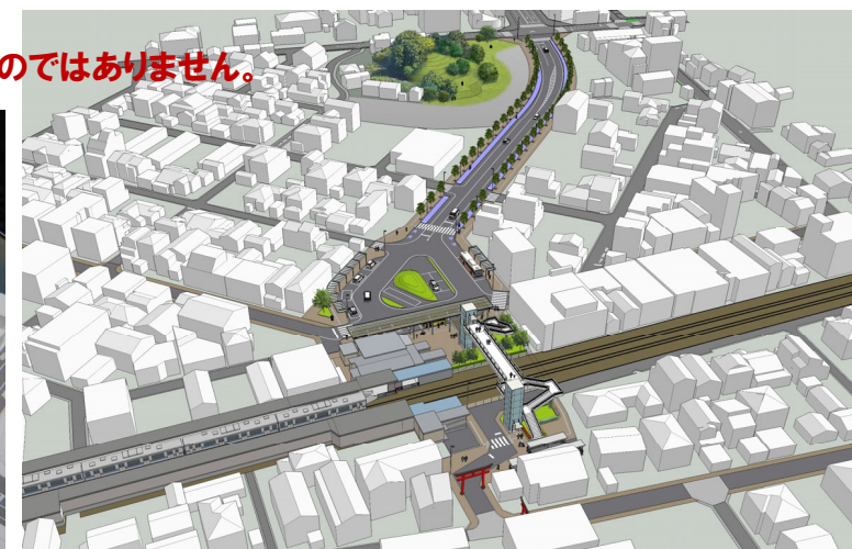
■ 駅前広場・北信太駅前線の模型と鳥瞰イメージ図(案) ■