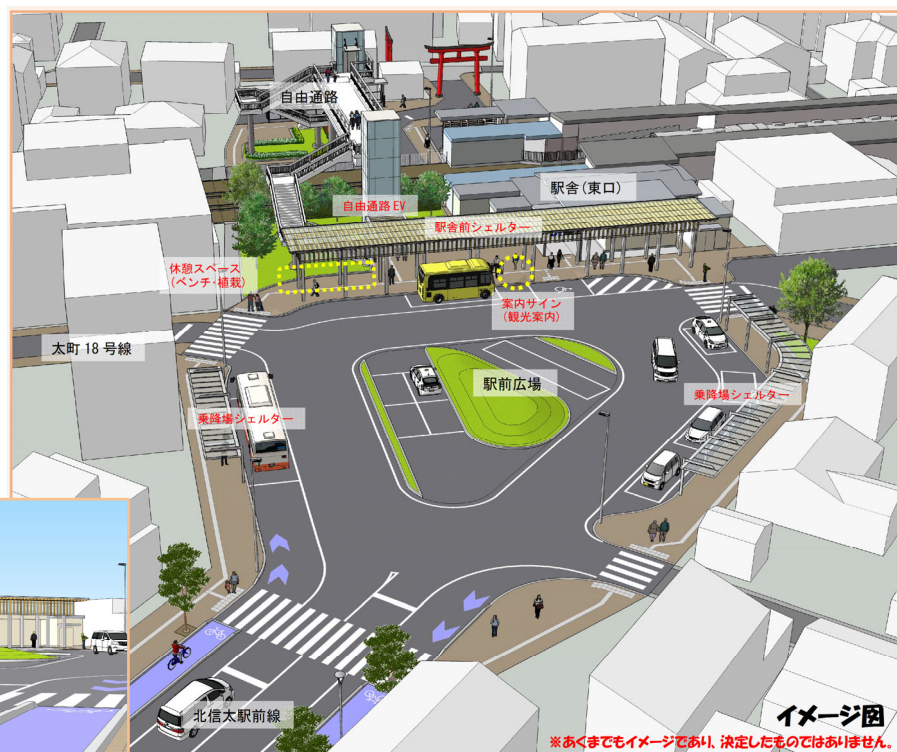
■ 「駅前広場の整備イメージ(案)」 ■

古くから街道筋の街として発展してきた歴史的背景を踏まえ、現代の街道(阪和線)の拠点としての求心力あるデザインとします。