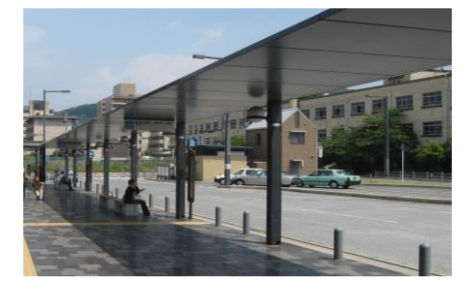
乗降場シェルター(イメージ)