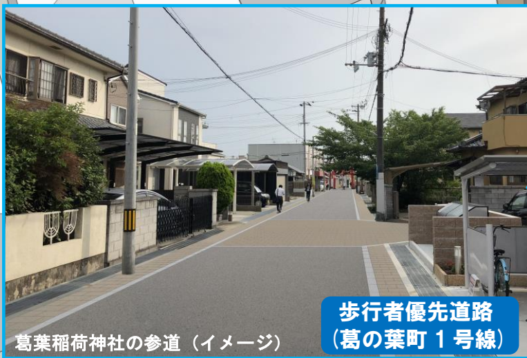
歩行者優先道路 (葛の葉町1号線)