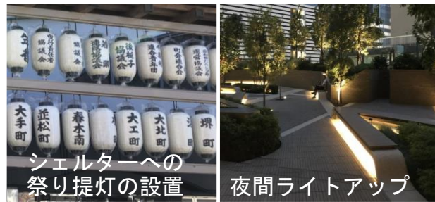
駅前広場の演出(イメージ)