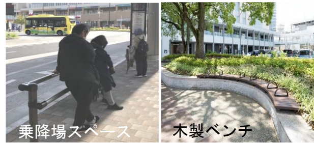
休憩スペースの配置(イメージ)