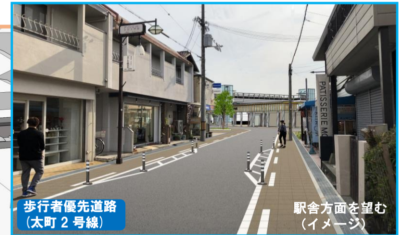
歩行者優先道路(太町2号線) 駅舎方面を望む(イメージ)