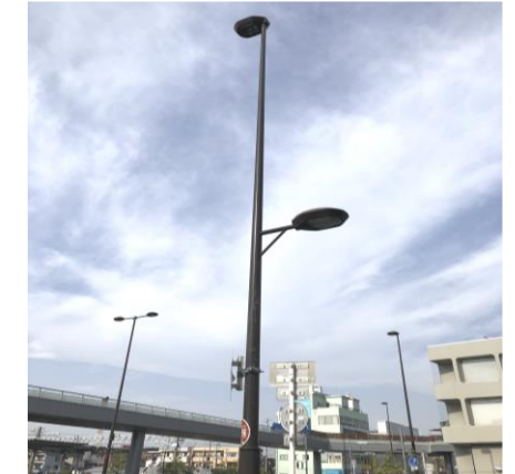
照明灯ポール(イメージ)