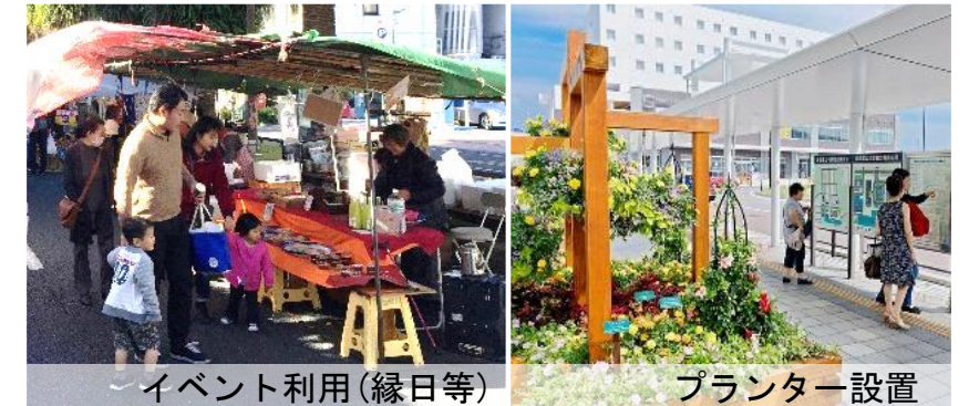
■ オープンスペース(活用イメージ)