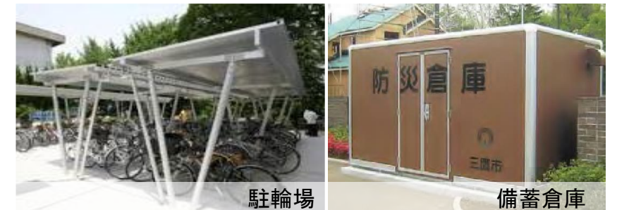
■ 駐輪場・備蓄倉庫の設置(イメージ)