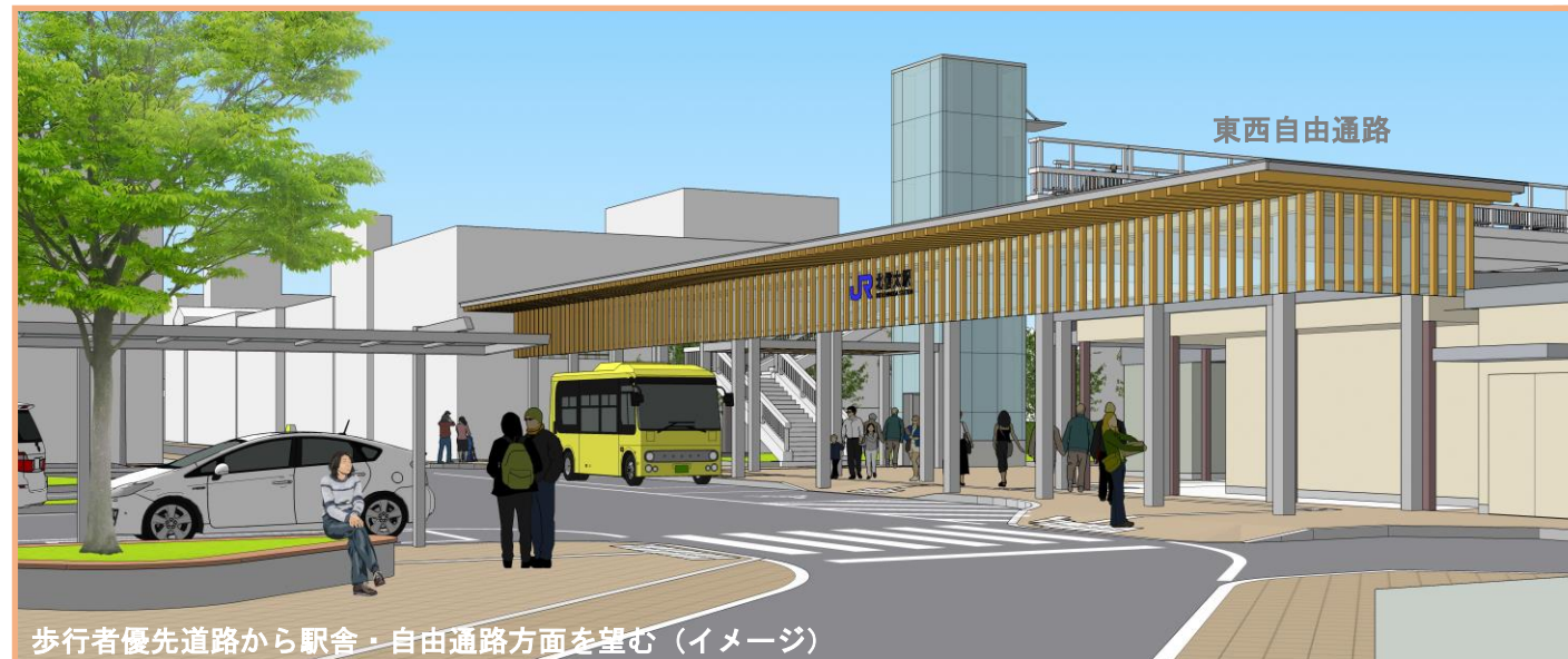
歩行者優先道路から駅舎・自由通路方面を望む(イメージ)