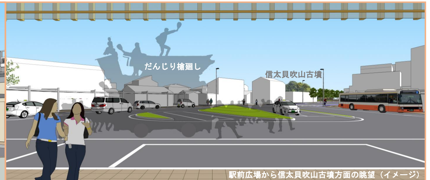
駅前広場から信太貝吹山古墳方面の眺望(イメージ)

注) パースは検討部会の意見を反映したイメージです。今後の関係各機関との協議・調整等により変更が生じます。