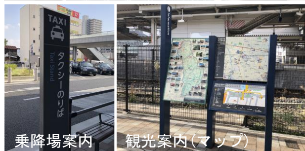
案内サインの配置(イメージ)