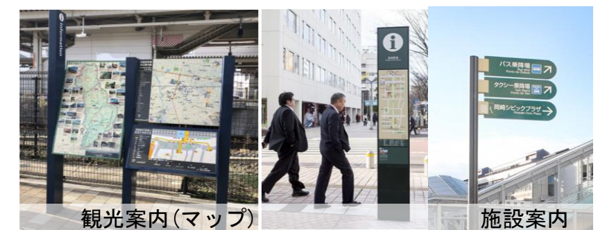
■ 案内サインの設置(イメージ)