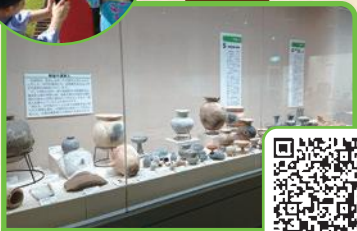
いずみの国歴史館