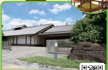
和泉市久保惣記念美術館