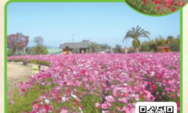
和泉リサイクル環境公園