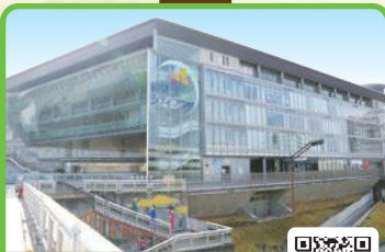
和泉シティプラザ