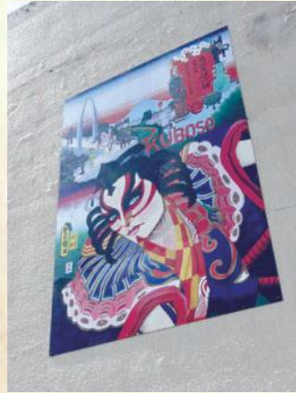
エコール・いずみ