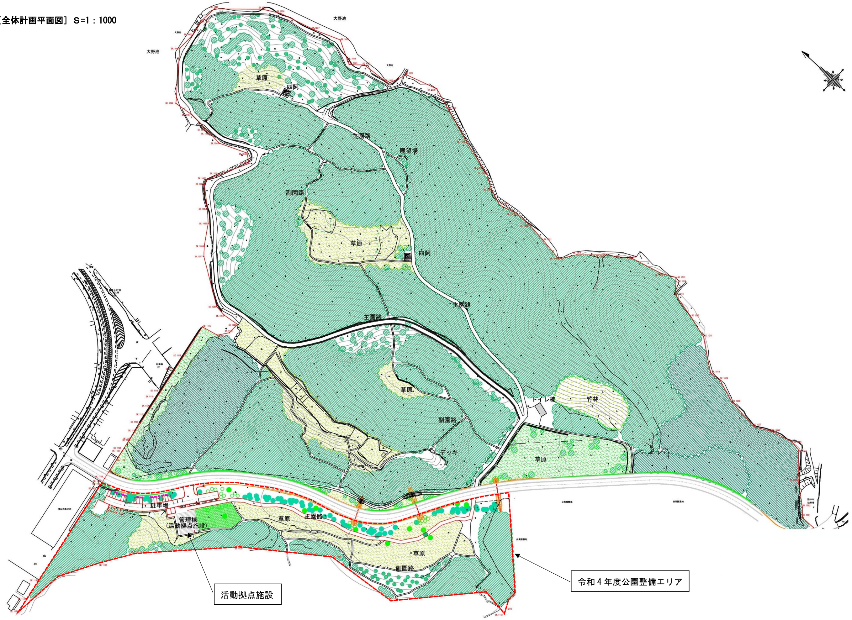
[全体計画平面図] S=1 : 1000