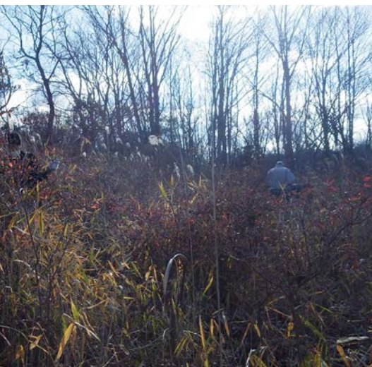
ツツジの丘 (草刈り前)