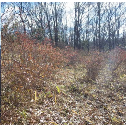
ツツジの丘 (草刈り後)