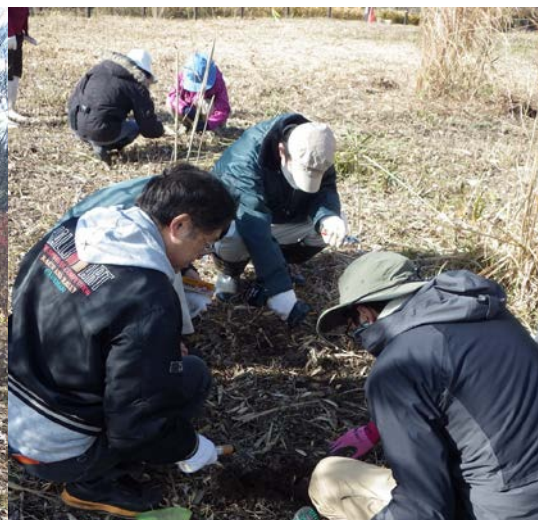
ケイピンエースの打ち込みの様子