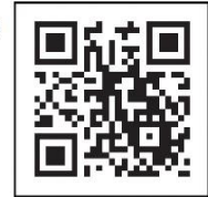
ကိုရိုနာဗိုင်းရပ်စ် ကာကွယ်ဆေး လမ်းညွှန် နှစ်ဖက်မြင်ဘားကုတ်ဒ်

ကိုရိုနာဗိုင်းရပ်စ်ကာကွယ်ဆေး လမ်းညွှန်ဝက်ဘ်ဆိုက်လိပ်စာ: https://v-sys.mhlw.go.jp