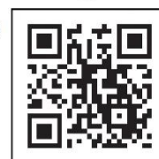
Двумерный штрихкод вакцины от коронавируса