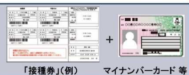
「接種券」(例) マイナンバーカード等