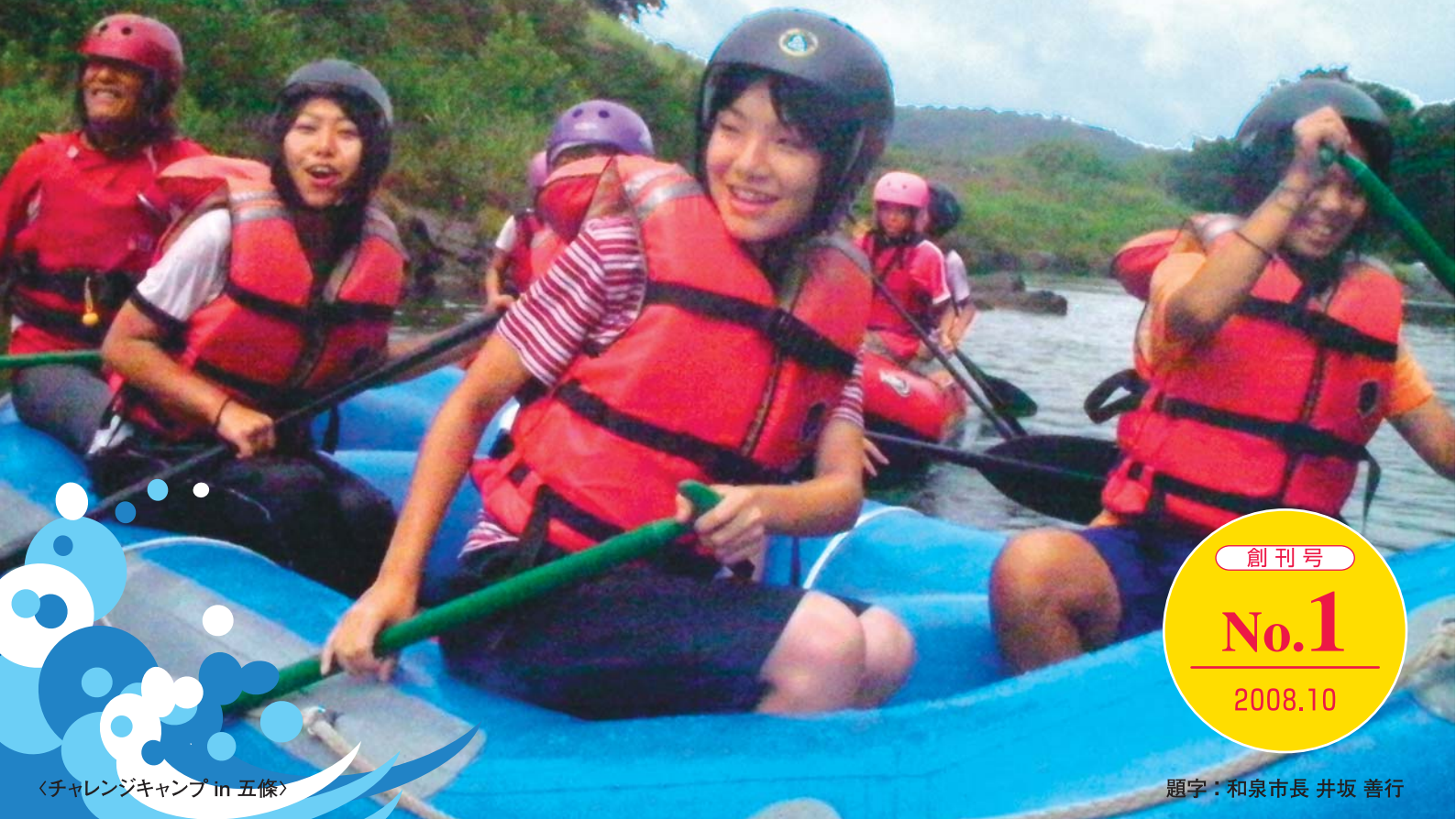
〈チャレンジキャンプ in 五條〉