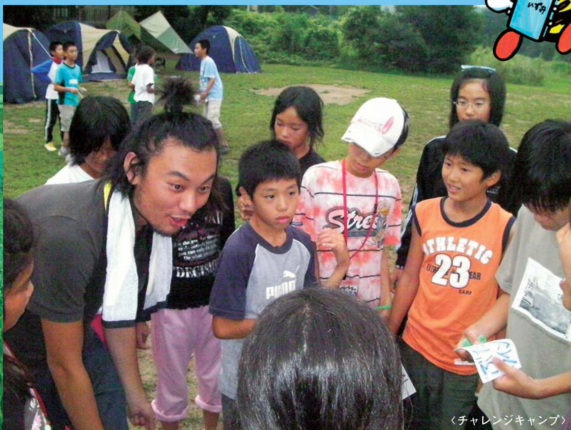
〈チャレンジキャンプ〉