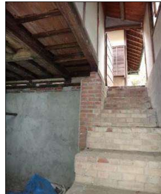
茶室地下西側階段