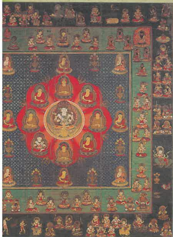
孔雀経曼荼羅図(重要文化財) 部分