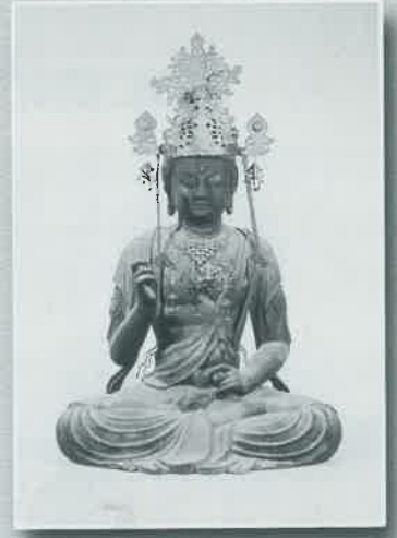
■観福寺弥勒菩薩坐像