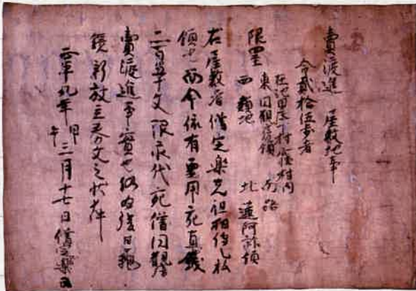
備定楽屋敷地売券(正平9(1354)年・高橋家文書)