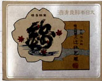
辻林酒造「錦」のレッテル(個人蔵)