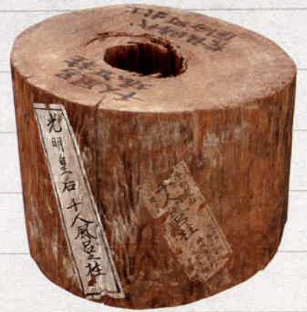
国分町・千人風呂出土の柱(7世紀頃・国分寺および羅漢寺蔵)