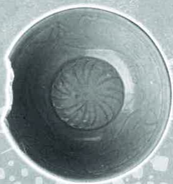
青磁碗 万町北遺跡(和泉市教育委員会)