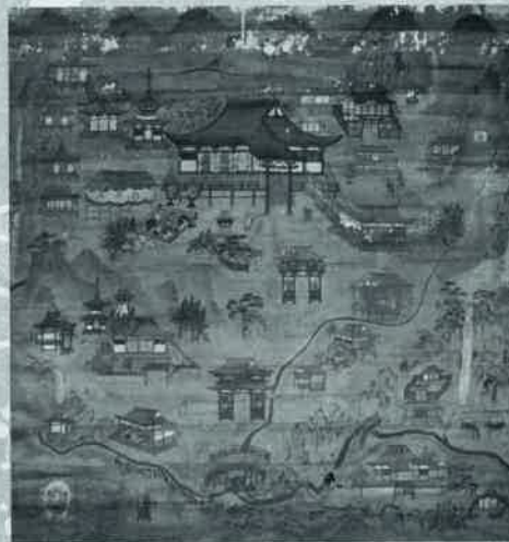
施福寺参詣曼荼羅 丙本(施福寺)