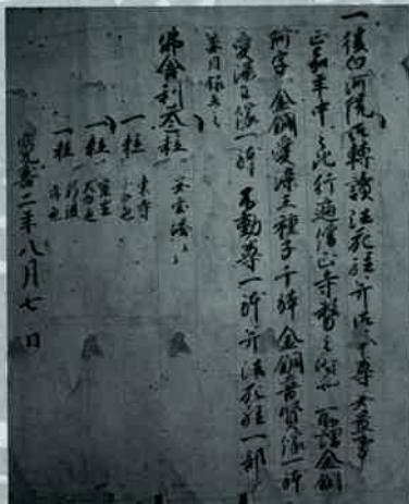
檟尾山大縁起(三光丸クスリ資料館)