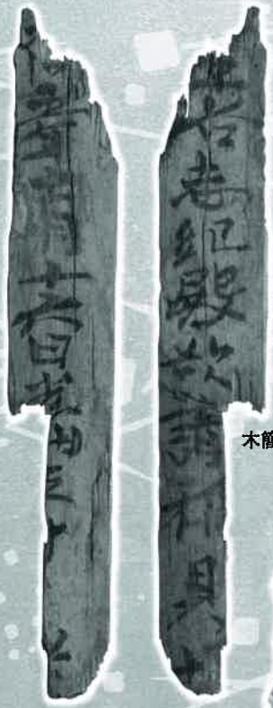
木簡 万町北遺跡(和泉市教育委員会)